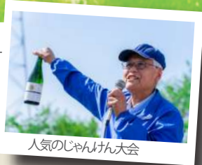
人気のじゃんけん大会

オリジナルワイングラスを持って、好きなワインを楽しもう(価格はマップ、各ブースでご確認ください)